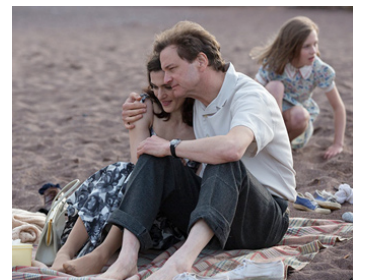
2018 LE JOUR DE MON RETOUR (The Mercy) de James Marsh avec Colin Firth