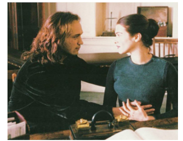
1997 AU CŒUR DE LA TOURMENTE (Swept from the Sea) de Beeban Kidron avec Vincent Perez