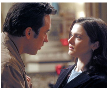
2003 LE MAÎTRE DU JEU (Runaway Jury) de Gary Fleder avec John Cusack