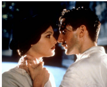
1999 SUNSHINE (Sunshine) d'Istvan Szabo avec Ralph Fiennes