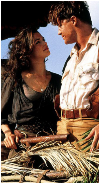
2001 LE RETOUR DE LA MOMIE (The Return of the Mummy) de S. Sommers avec Brendan Fraser