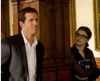
2008 UN JOUR PEUT-ÊTRE (Definitely, Maybe) d'Adam Brooks avec Ryan Reynolds