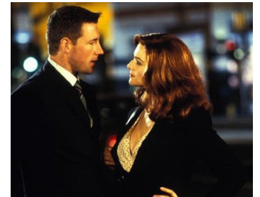
2003 CONFIDENCE (Confidence) de James Foley avec Edward Burns