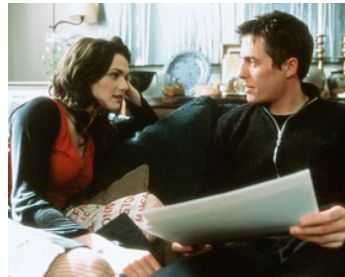
2002 POUR UN GARÇON (About a Boy) de Chris et Paul Weitz avec Hugh Grant