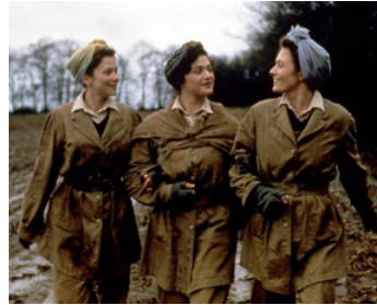
1998 3 ANGLAISES EN CAMPAGNE (The Land Girls) de D. Leland avec Anna Friel, Catherine McCormack