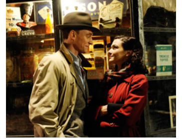
2011 THE DEEP BLUE SEA (The Deep Blue Sea) de Terence Davies avec Tom Hiddleston