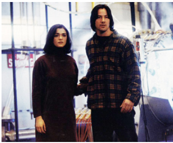
1996 POURSUITE (Chain Reaction) d'Andrew Davies avec Keanu Reeves