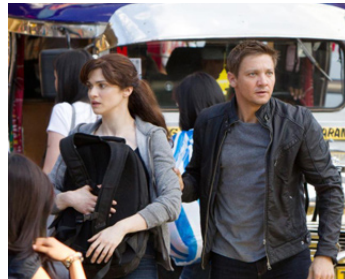
2012 JASON BOURNE, L'HÉRITAGE (The Bourne Legacy) de Tony Gilroy avec Jeremy Renner