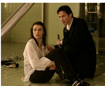
2005 CONSTANTINE (Constantine) de Francis Lawrence avec Keanu Reeves