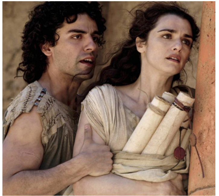
2009 AGORA (Agora) d'Alejandro Amenabar avec Oscar Isaac