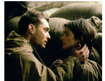
2001 STALINGRAD (Enemy at the Gates) de Jean-Jacques Annaud avec Jud Law