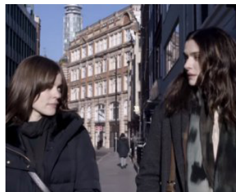
2017 DÉSOBÉISSANCE (Disobedience) de Sebastian Lelo avec Amy McAdams