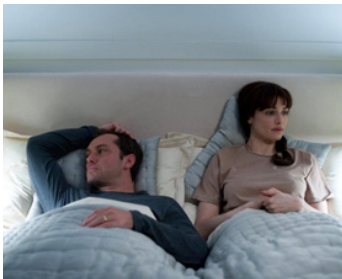
2011 TROIS CENT SOIXANTE (360) de Fernando Meirelles avec Jude Law