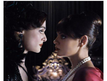
2013 LE MONDE FANTASTIQUE D'OZ (Oz, the great and powerful) de S. Raimi avec Mila Kunis