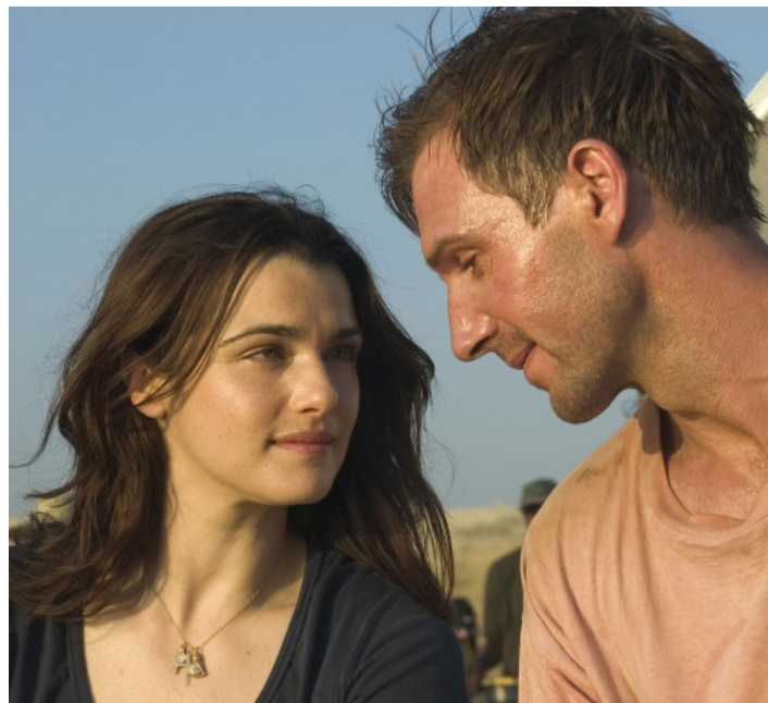
2005 THE CONSTANT GARDENER (The Constant Gardener) de Fernando Meirelles avec Ralph Fiennes