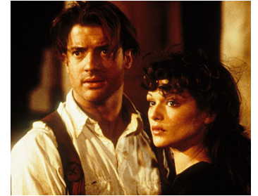
1999 LA MOMIE (The Mummy) de Stephen Sommers avec Brendan Fraser