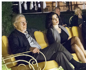
2015 YOUTH (La Giovinezza) de Paolo Sorrentino avec Harvey Keitel