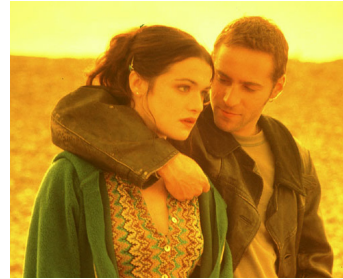
1998 I WANT YOU (I want you) de Michael Winterbottom avec Alessandro Nivola