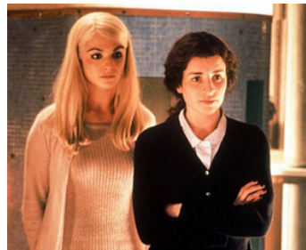
2000 CRIMES MAQUILLÉS (Beautiful Creatures) de Bill Eagles avec Susan Lynch