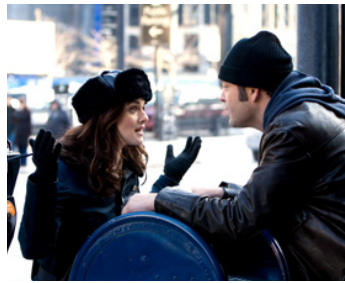
2007 FRÈRE NOËL (Fred Claus) de David Dobkin avec Vince Vaughn