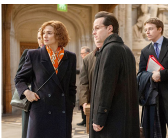
2016 LE PROCÈS DU SIÈCLE (Denial) de Mick Jackson avec Andrew Scott, Jack Lowden