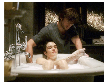
2006 THE FOUNTAIN (The Fountain) de Darren Aronofsky avec Hugh Jackman