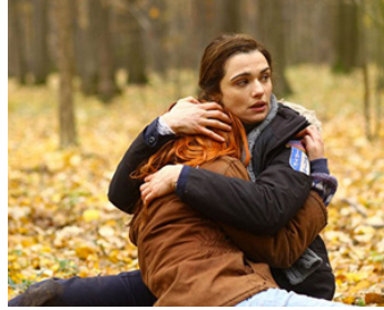
2010 SEULE CONTRE TOUS (The Whistleblower) de Larysa Kondracki avec Roxana Condurache