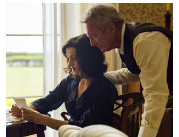
2016 UNE VIE ENTRE 2 OCÉANS (The Light between Oceans) de Derek Cianfrance avec Bryan Brown