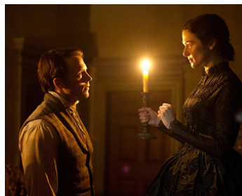
2017 MA COUSINE RACHEL (My Cousin Rachel) de Roger Michell avec Sam Claflin