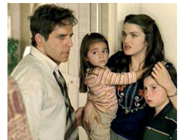
2004 L'ENVIE (Envy) de Barry Levinson avec Ben Stiller