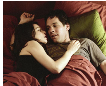
2003 FAUSSES APPARENCES (The Shape of Things) de Neil LaBute avec Paul Rudd