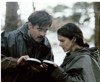
2015 THE LOBSTER (The Lobster) de Yorgos Lanthimos avec Colin Farrell