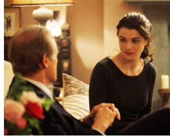
2011 PAGE HUIT (Page Eight) de David Hare avec Bill Nighby