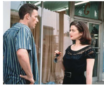
1997 GOING ALL THE WAY de Mark Pellington avec Ben Affleck