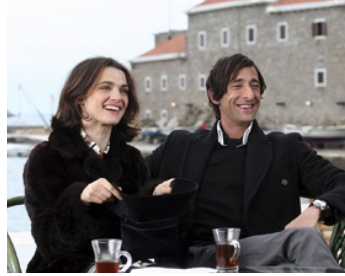
2008 UNE ARNAQUE PRESQUE PARFAITE (The Brothers Bloom) de R. Johnson avec Adrian Brody